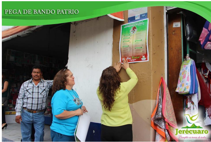
COLOCACIÓN DEL BANDO PATRIO EN NEGOCIOS DEL CENTRO HISTÓRICO