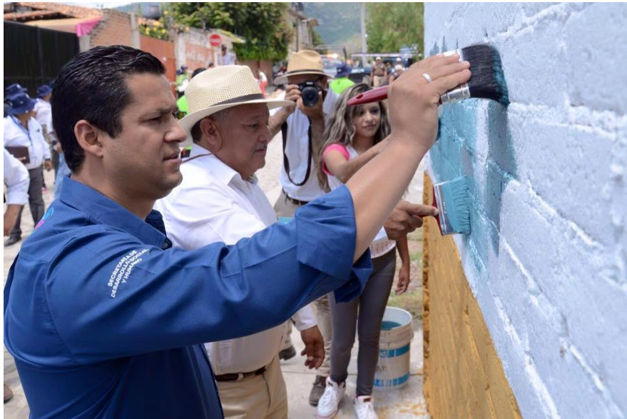
PINTANDO EL MURAL EN LA LOCALIDAD DE PURUAGUA