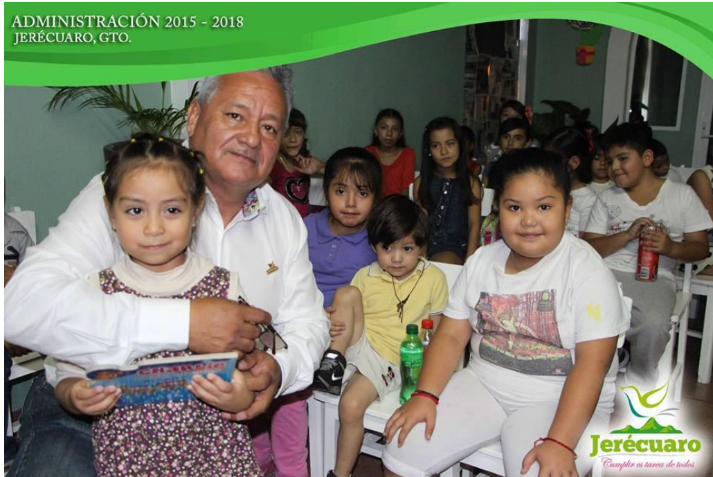
PARTICIPACIÓN DE CHICOS Y GRANDES