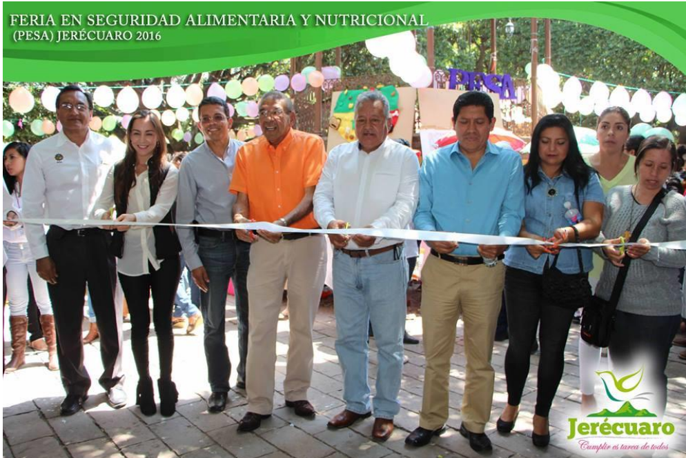
INAUGURACIÓN DE LA MUESTRA GASTRONÓMICA