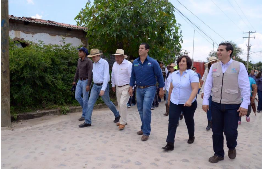
ARRIBO DEL CONTINGENTE A LA COLONIA "VISTA HERMOSA" EN CABECERA MUNICIPAL