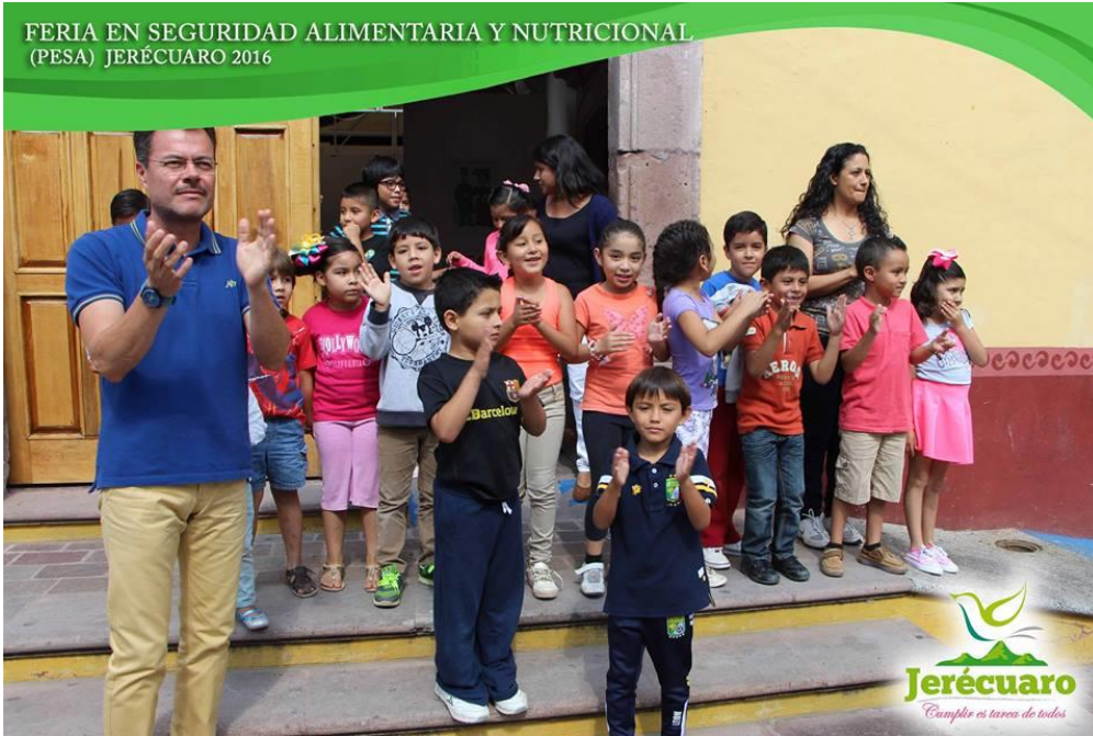
MAESTRO Y ALUMNOS DE CURSOS DE VERANO DE CASA DE CULTURA PRESENCIANDO EL DESFILE

FERIA EN SEGURIDAD ALIMENTARIA Y NUTRICIONAL (PESA) JERÉCUARO 2016