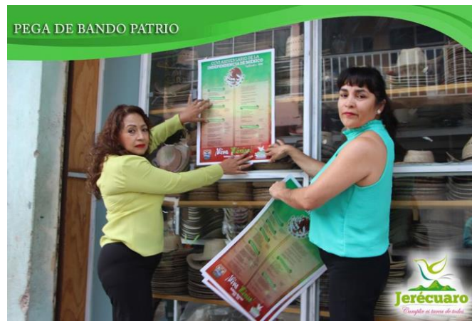
LOS COMERCIANTES ESTABLECIDOS RECIBIERON CON AGRADO EL BANDO SOLEMNE