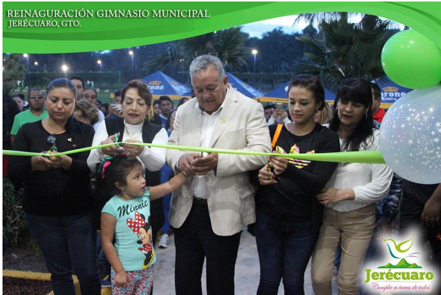
CORTE DEL LISTÓN EN COMPAÑÍA DE INTEGANTES DEL H. AYUNTAMIENTO

REINAGURACIÓN GIMNASIO MUNICIPAL JERÉCUARO, GTO.