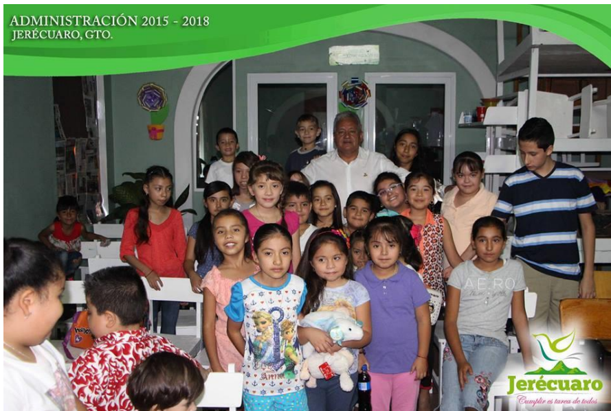
UNA FOTO QUE PERDURARÁ EN EL RECUERDO

ADMINISTRACIÓN 2015 - 2018 JERÉCUARO, GTO.