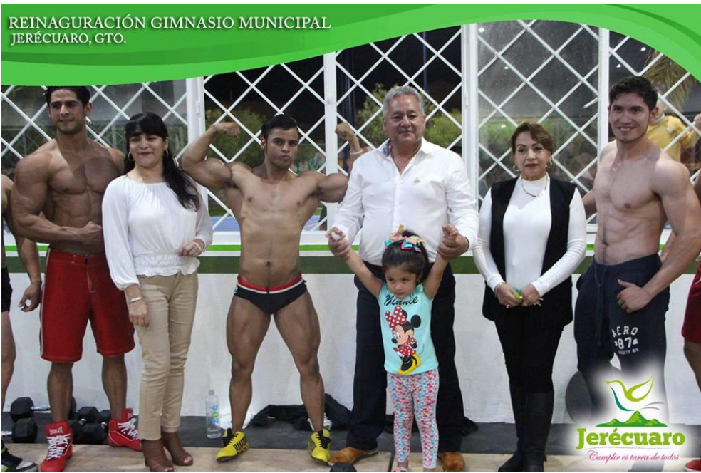
PARTICIPACIÓN DE DEPORTISTAS INVITADOS AL EVENTO