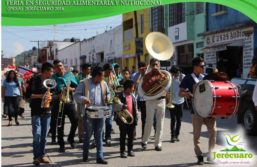
PARTICIPACIÓN QUE SE AGRADECE DE LA BANDA DE VIENTO SAN MIGUEL DE LA LOCALIDAD DE ESTANZUELA DE RAZO